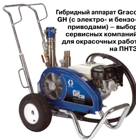
Гибридный аппарат Graco GN (с электро- и бензоприводами) – выбор сервисных компаний для окрасочных работ на ПНТЗ

сопутствующих материалов, при доставке материалов до объекта, при подготовке защищаемой поверхности, при нанесении. Нарушение технологии на одном из этапов приводит к изготовлению ненадежного покрытия или к значительному увеличению затрат.