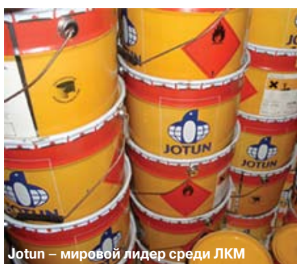
Jotun – мировой лидер среди ЛКМ

Если к данному вопросу относиться серьезно, а не как обычно: «Ну что может быть сложного в покраске, намазал и готово», то становится ясно, что качественное покрытие изготавливается не только на заводе. Надежность покрытия формируется при изготовлении