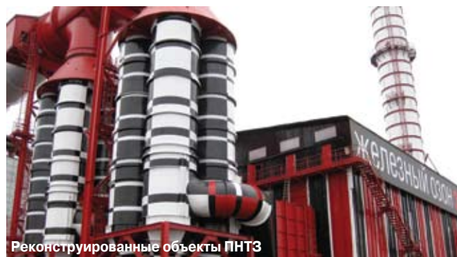
Реконструированные объекты ПНТЗ

эпоксиполиуретановые системы, которые использовались при нанесении АКЗ, показали себя с наилучшей стороны. Кроме того, поставщик самостоятельно осуществлял техническое инспектирование всего процесса нанесения материалов, что позволило нам быть уверенными в качестве работ подрядных организаций.